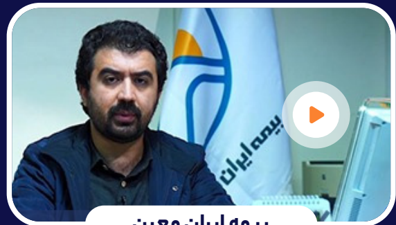
بیمه ایران معین